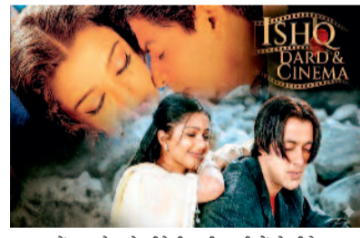
सदमा में जब ट्रेन से श्रेयदी चली जाती है तो पीछे कमल हासन का ड्रैवना हमें आज भी सताता है। हम दिल दे चुके सनम में सलमान खान के

नई दिल्ली। आज तक हम इस दुख में हैं कि गजनीमें कल्पना को अंत तक नहीं पता चल पाया कि सचिन ही संजय सिंहनिया है। हमें आज भी अफसोस होता है कि आमिर खान क्यों सही वक्त पर पहुंचकर आसिन को नहीं बचा पाए। तबरे नाम में जब राधे पागलखाने पहुंच जाता है और निर्जरा जहर पी लेती है, तो हम अंदर तक दुखी हो जाते हैं। राइडिंग में कुन्दन का जोया के लिए आखिरी मोनोलॉग आज भी तीर की तरह हमें चुभता है। सनम तेरी कसम में सरस्वती को मरते देख हम सब आंसू बहाते हैं। कल हो ना हो में शाहरुख खान का किरदार अनम नायक चल बसता है, लेकिन हम आज भी उस फिल्म को याद करते हैं।