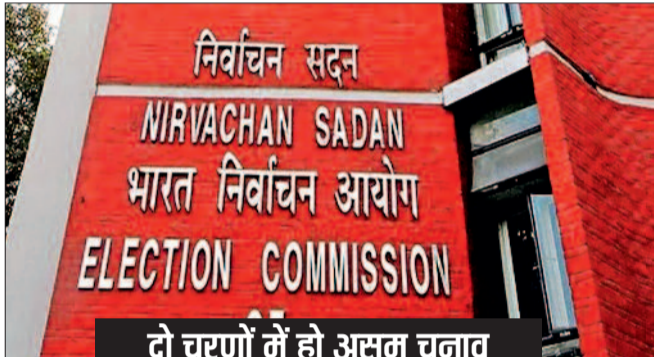
दो चरणों में हो असम चुनाव

असम विधानसभा के चुनाव अप्रैल के पहले हफ्ते में हो सकते हैं। चुनाव आयोग इसका ऐलान अगले महीने 4 से 8 मार्च के बीच कर सकता है। रिपोर्ट्स के मुताबिक सभी 126 सीटों के लिए एक या अधिकतम दो फेज में वोटिंग होने की संभावना है। मंगलवार को भाजपा, कांग्रेस सहित राज्य की छोटी-बड़ी राजनीतिक पार्टियों ने चुनाव आयोग के साथ बैठक में इसकी मांग रखी है। पार्टियों ने चुनाव की तारीख बिहू त्योहार के आसपास रखने की अपील की है ताकि ज्यादा से ज्यादा लोग वोटिंग कर सकें।