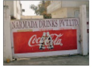
हरिभूमि न्यूज ►► बिलासपुर

सिरगिट्टी औद्योगिक क्षेत्र स्थित नर्मदा ड्रिक्स प्राइवेट लिमिटेड में आयकर विभाग की टीम ने मंगलवार को सुबह छाप मारा। टीम सुबह 5 बजे फैक्ट्री पहुंची और अंदर मौजूद रिपोर्ट-दस्तावेजों की जांच शुरू कर दी। टीम में 10 अधिकारी थे जो तीन गाड़ियों में पहुंचे थे। फैक्ट्री पहुंचते ही आईटी की टीम ने कंपनी के अकाउंट, स्टॉक और वित्तीय लेनदेन से जुड़े कागजात का अपन कब्जे में ले लिया और खंगालना शुरू कर दिया। कार्रवाई के दौरान फैक्ट्री के अंदर-बाहर गतिविधियों पर शेष पेज 7 पर