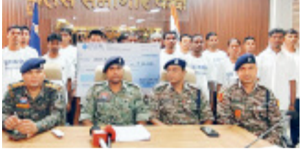
हरिभूमि न्यूज ►► जगदलपुर